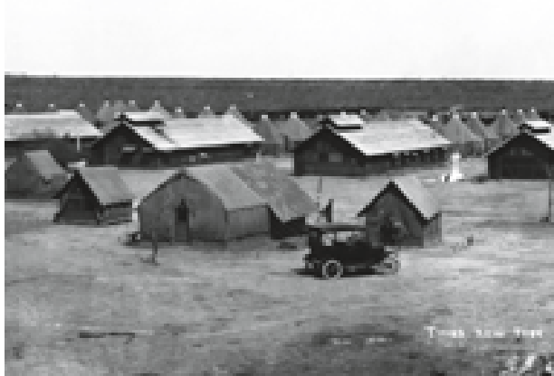
View of Fort Brown, c. 1913. Photographer Robert Runyon's views of the historic fort were popular among both soldiers and local residents. (RUN1250)

Puente Internacional que cruza el Río Grande entre Brownsville y Matamoros, alrededor de 1910-1926.