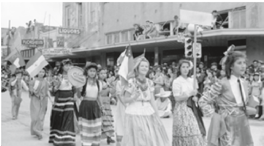
Charro Days Fiesta parade in Brownsville, 1942. The annual festival was first organized in 1937 to celebrate the heritage and friendship shared by the neighboring border towns of Brownsville, Texas, and Matamoros, Mexico.