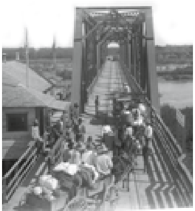
International Bridge crossing the Rio Grande between Brownsville and Matamoros, c. 1910-1926. (RUN3751)