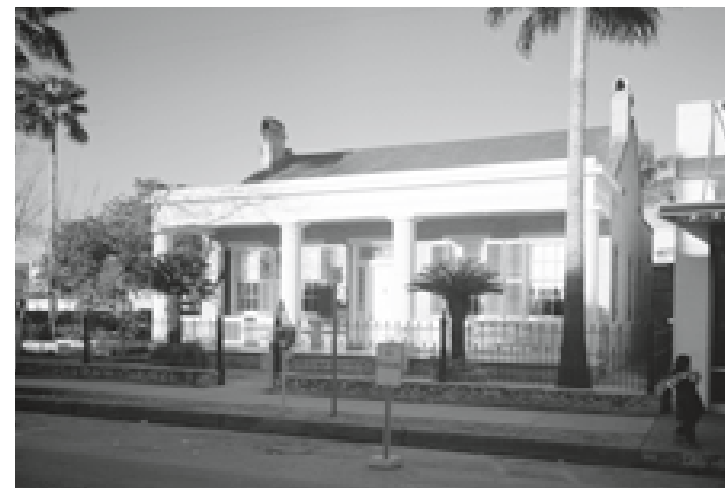
Built in the 1850s, the Stillman House was the home of Brownsville founder Charles Stillman. The historic building is one of the oldest residences in Brownsville and is now home to the Stillman House Museum.

Charles Stillman (1810-1875) fundó Brownsville, Texas, el 13 de enero de 1849.