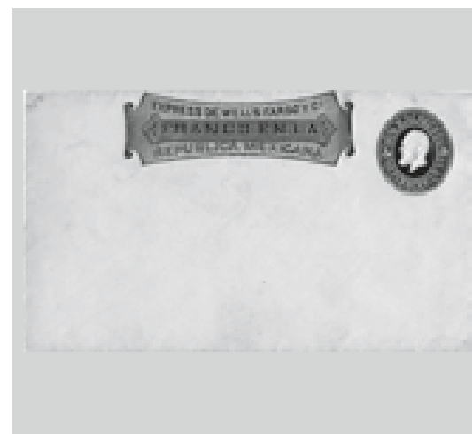
A pre-paid Wells Fargo envelope for correspondence in Mexico. By 1918, Wells Fargo had 10,000 offices from "Ocean to Ocean" and "From over the Sea."

Mapa del puesto de Fuerte Brown, publicado en 1877. El Fuerte Brown se estableció en 1846 y lleva su nombre en honor al Comandante Jacob Brown.