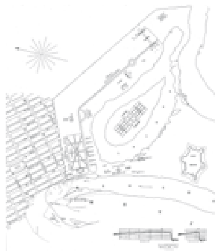
Map of the post of Fort Brown, published in 1877. Fort Brown was established in 1846 and named for Major Jacob Brown.

Vista del Fuerte Brown, alrededor de 1913. La vistas del fotógrafo Robert Runyon del histórico fuerte fueron populares entre los soldados y los residentes locales.